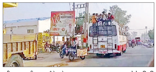
सीवन। बस की छत पर बैठे बच्चे।