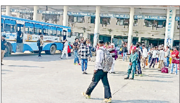
जीद। रोडवेज बस अड्डा।

कुरुक्षेत्र में 25 नवंबर मंगलवार को प्रधानमंत्री नरेंद्र मोदी आ रहे हैं। उनके आगमन पर जीद से लोगों को ले जाने के लिए कुल 173 बसें जाएंगी। इसमें रोडवेज बसों की संख्या 113 व परिवहन समिति की 60 बस शामिल हैं। हालांकि पहले रोडवेज और परिवहन समिति की कुल 160 बस भेजे जाने की योजना बनाई गई थी लेकिन अब पहले की अपेक्षा में ज्यादा बस कुरुक्षेत्र भेजी जाएंगी। जीद डिपो में रोडवेज बसों की संख्या लगभग 170 है और परिवहन समिति की 162 बस अलग-अलग लोकल रूटों पर दौड़ रही है। ऐसे में मंगलवार को 57 रोडवेज और परिवहन समिति की 102 परिवहन समिति की बस ही यात्रियों के लिए