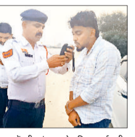
चालकों की जांच करते पुलिस कर्मचारी

एक सप्ताह तक विशेष अभियान चला किए 115 वाहनों के चालान