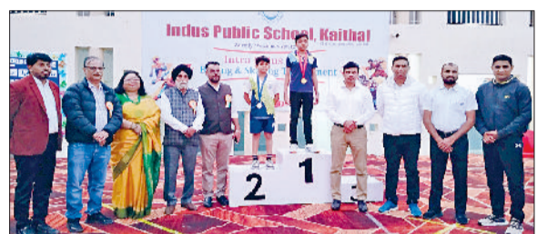
कैथल। अवल रह खिलाड़ियों को सम्मानित करते अधिकारी।