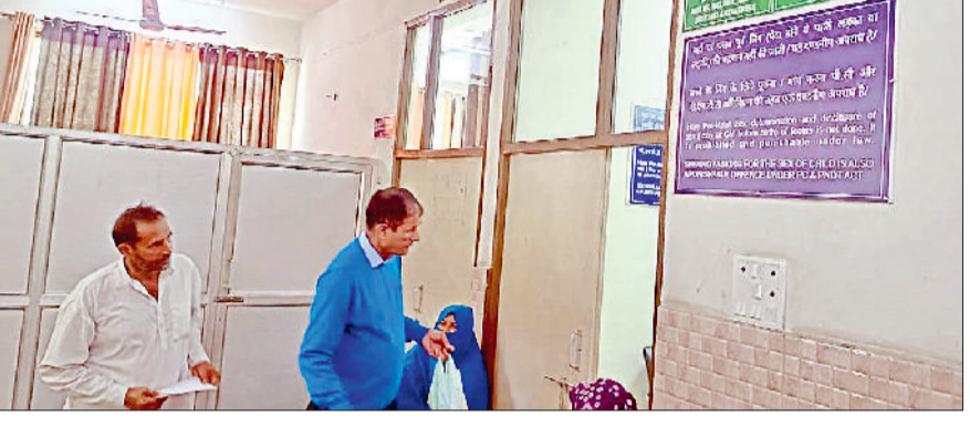
जींद। अल्ट्रासाउंड के लिए पूछताछ करते गर्भवती महिलाओं के परिजन।

नागरिक अस्पताल में गर्भवती महिलाओं के निःशुल्क किए जाते हैं अल्ट्रासाउंड