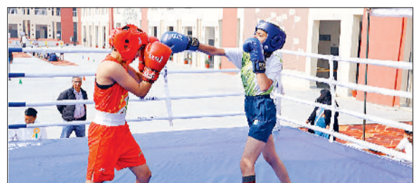
कैथल। बॉक्सिंग में दमखम दिखाते खिलाड़ी।