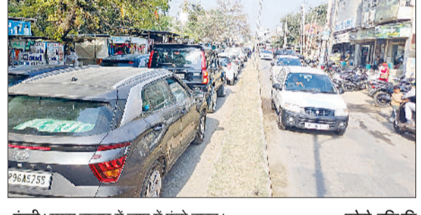
पड़री। मुख्य बाजार में जाम में फंसे वाहन।

हरिभूमि न्यूज पड़री गिरधरलाल अहलूवालिया चौक से लेकर मुख्य बाजार पुंडरीक तीर्थ मार्ग तक प्रतिदिन गाड़ों की स्थिति बनी रहती है। सड़क पर बढ़ता अतिक्रमण न केवल वाहन चालकों को परेशान कर रहा है, बल्कि पैदल चलने वाले राहगीरों के लिए भी बड़ी समस्या बन चुका है।