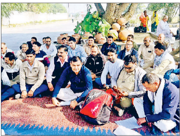
जीद। मांगों को लेकर रोष जताते हुए रोडवेज कर्मचारी।